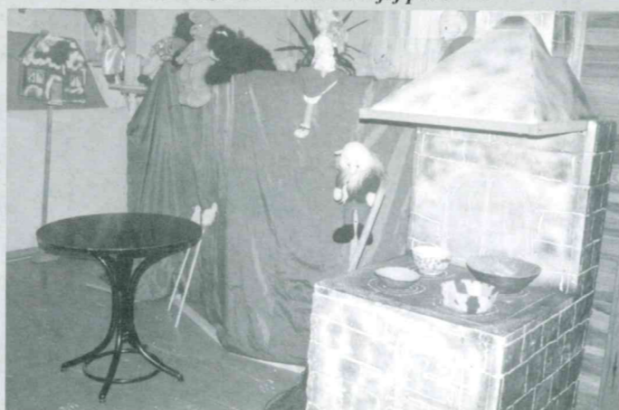
W M-GOK można oglądać wystawę scenografii teatralnej do Teatryku Kukielkowego „Pucioś”

Słoneczna, sucha i ciepła pogoda sprzyjała tej jesieni zbiorom buraków cukrowych