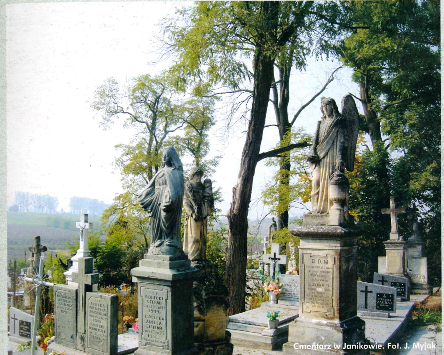
Cmentarz w Janikowie.

Samorządowe pismo społeczno-kulturalne Nr 9-10/77-78 wrzesień-październik 2005 Rok VII ISSN 1507-7438 Nakład 1000 egz. © PAIR MYJAKPRESS