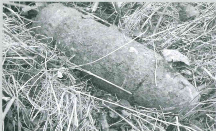
W Julianowie wojna znowu dała znać o sobie. Radny Jerzy Nogaj w czasie prac polowych trafił na niewybuchy. Na szczęście zostały zabezpieczone przez saperów.