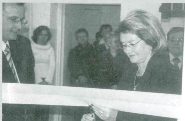
Ośrodek Pomocy Społecznej w Ożarowie otworzył stolówkę dla potrzebujących