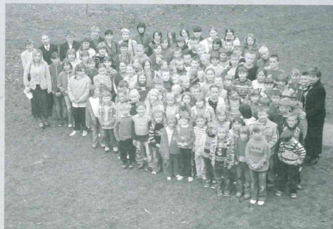
Uczniowie i nauczyciele Szkoły Podstawowej w Janowicach obchodzili 140 - lecie swojej placówki