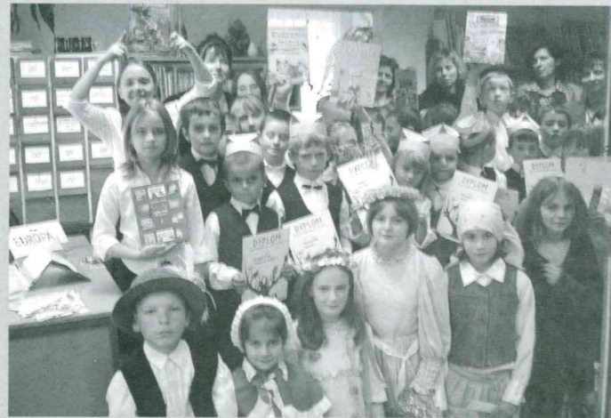
W jakubowickiej bibliotece znowu odbyło się pasowanie na młodego czytelnika